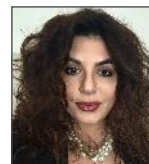
Denise Ubbriaco Il Quotidiano del Sud