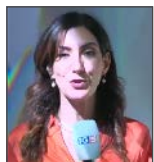
Valentina Celi TG 5 Mediaset